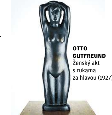
OTTO GUTFREUND Ženský akt s rukama za hlavou (1927)