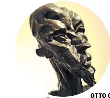
OTTO GUTFREUND Hlava Dona Quijota (1911-12)

V Paříži už proběhl první výtvarný workshop. Děti s pedagogem navštívily Galerii Messine, kde byla výstava sochaře Otty Gutfreunda. Nakreslily obrázky inspirované jeho tvorbou.